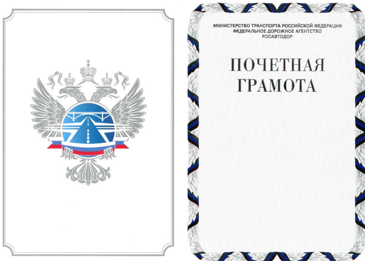
Рисунок Почетной грамоты Федерального дорожного агентства