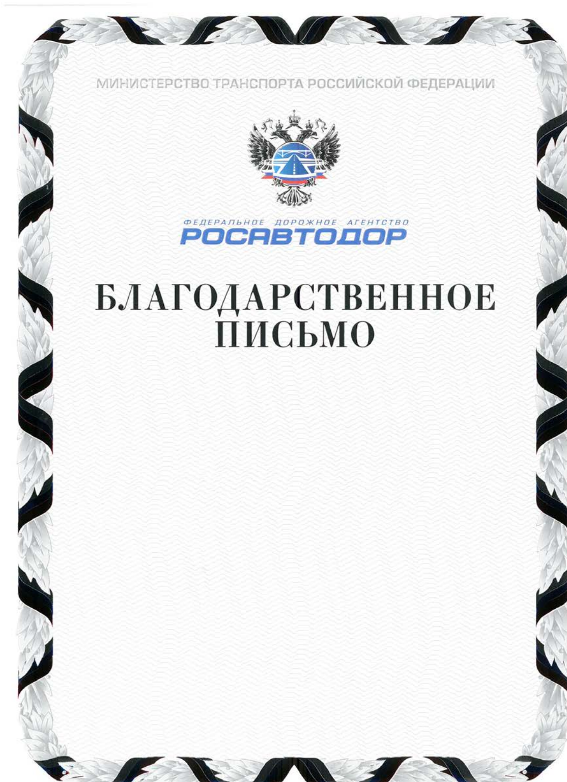
Рисунок Благодарственного письма Федерального дорожного агентства