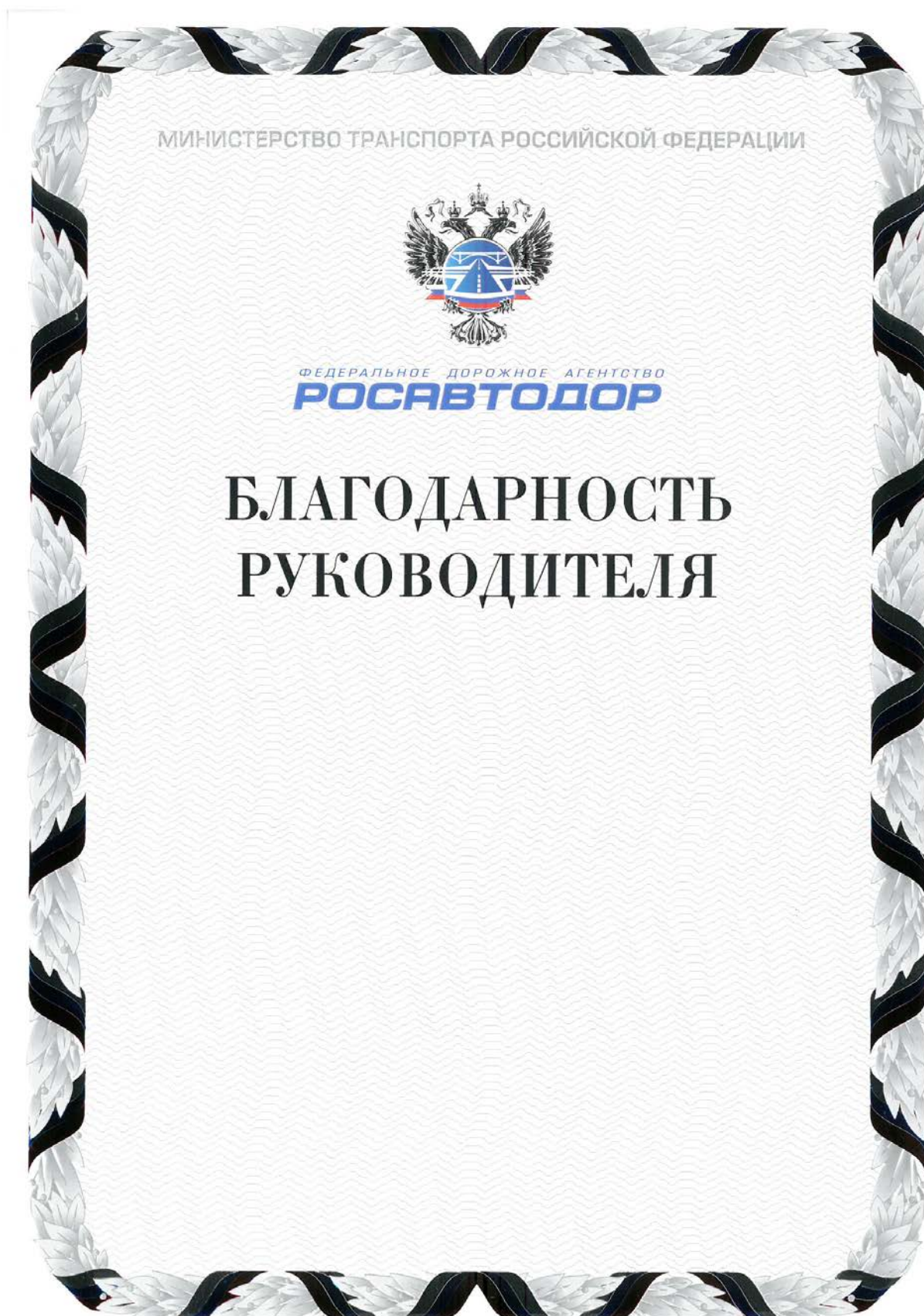
Рисунок Благодарности руководителя Федерального дорожного агентства